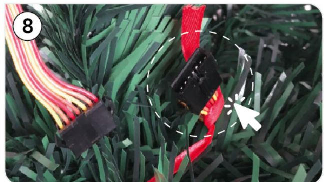
Schritt 8: Im letzten Schritt Stecken Sie bitte die beiden Kabeln zusammen, damit der Zweite-Teil des Weihnachtsbaumes Strom bekommt und die LED-Leuchten