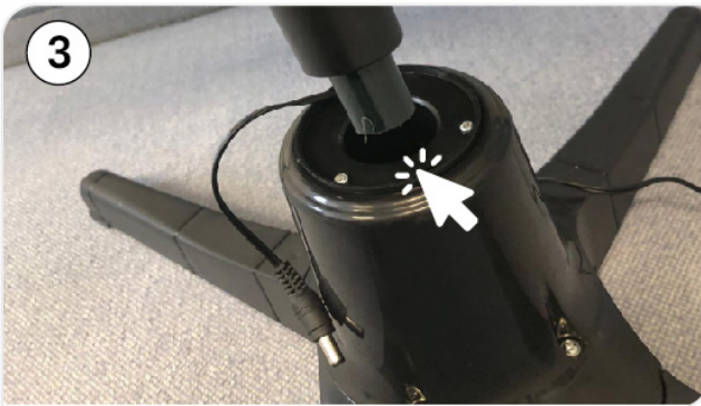
Schritt 3: Unterstes Teil des Weihnachtsbaumes in den Ständer stellen.