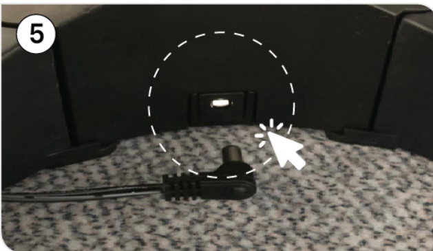
Schritt 5: Netzstecker in den Weihnachtsbaumständer einstecken