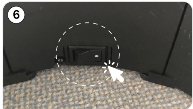
Schritt 6: Den Schalter am Weihnachtsbaum auf AN stellen