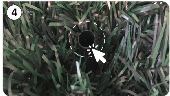
Schritt 4: Zweites Teil des Baumes aufsetzen