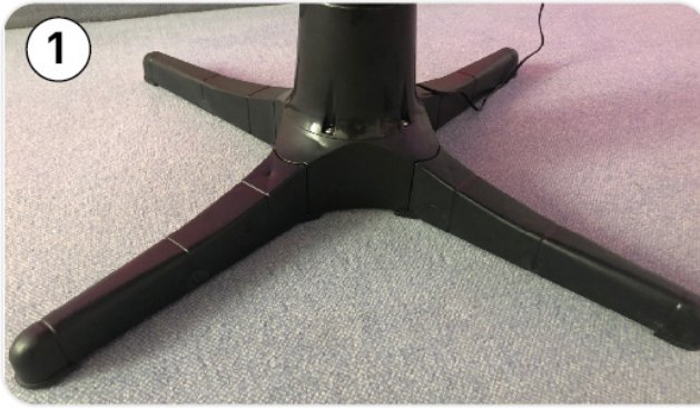
Schritt 1: Weihnachtsbaumständer Zusammenbauen und aufstellen